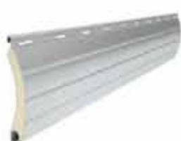
PA 52 wysokość profilu: 52mm grubość: 13mm