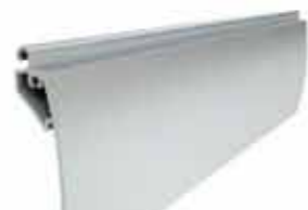
PEKP 77 wysokość profilu: 77mm grubość: 18,5mm