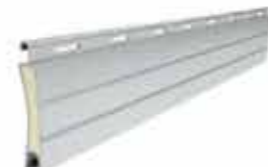
PA 40 wysokość profilu: 40mm grubość: 8,7mm