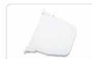
Zwijacze na linkę lub pasek