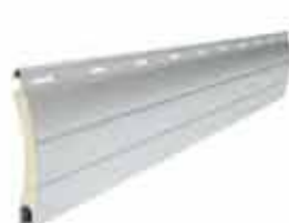
PA 45 wysokość profilu: 45mm grubość: 9mm