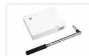
Kasety z przekładnią na linkę lub pasek