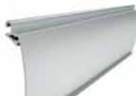
PEKP 80 wysokość profilu: 80mm grubość: 18,5mm