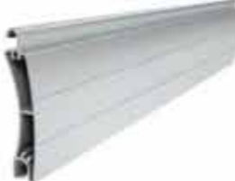
PE 55 wysokość profilu: 55mm grubość: 14mm