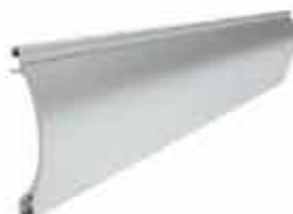
PEKP 52 wysokość profilu: 52mm grubość: 13mm