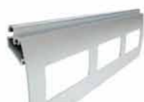
PEK 77 wysokość profilu: 77mm grubość: 18,5mm