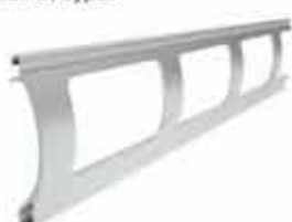
PEK 52 wysokość profilu: 52mm grubość: 13mm