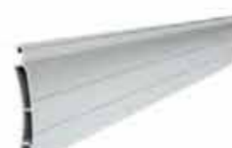
PE 41 wysokość profilu: 41mm grubość: 8,5mm