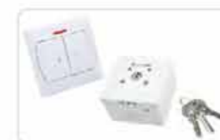
Przełączniki klawiszowe i kluczykowe