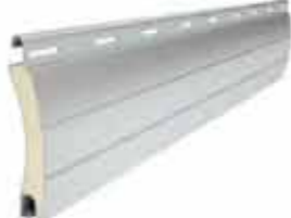
PA 55 wysokość profilu: 55mm grubość: 14mm