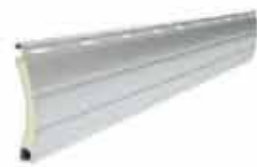
PA 39 wysokość profilu: 39mm grubość: 9mm