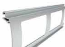
PEK 80 wysokość profilu: 80mm grubość: 18,5mm