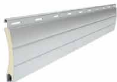
PA 45 wysokość profilu: 45mm grubość: 9mm