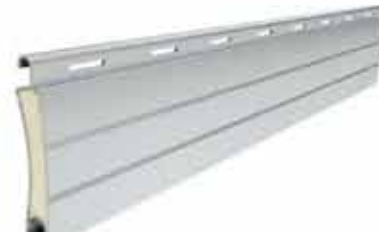
PA 40 wysokość profilu: 40mm grubość: 8,7mm