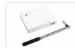
Kasety z przekładnią na linkę lub pasek