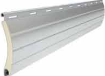
PA 52 wysokość profilu: 52mm grubość: 13mm