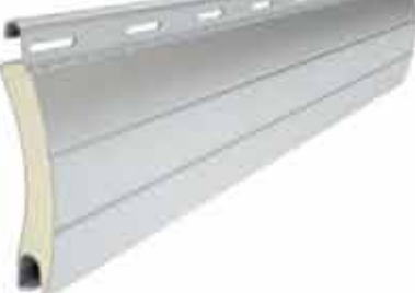
PA 55 wysokość profilu: 55mm grubość: 14mm