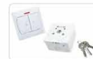
Przełączniki klawiszowe i kluczykowe