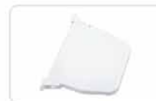
Zwijacze na linkę lub pasek